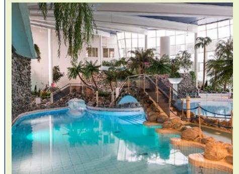
Im Spa-Bereich des Hotels