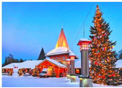
Postamt im Weihnachtsmandorf