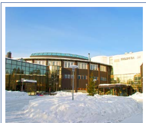
Holiday Club Kuusamon Tropiikki

Die geräumigen Appartements und Ferienhäuser liegen verstreut in der Anlage und bieten viel Platz für Familien und befreundete Paare. Neben 2 separaten Schlafzimmern, einem Wohnbereich mit Kamin und Sofaecke, einem Küchenbereich und einem verglasten Balkon bietet Ihnen die private Sauna im Bad Entspannung pur. Die Appartments verfügen