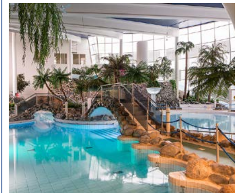
Im Spa-Bereich des Hotels